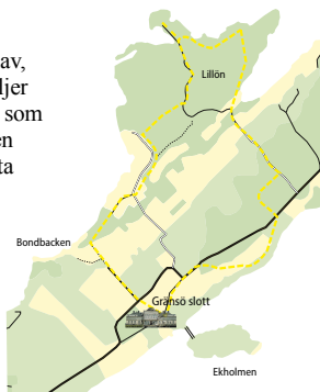
Följ den gula slingan (ej ledmärkt) på kartan för att gå Slottsherrens promenad.

Sommartid passar du på att ta ett morgon- eller kvällsdopp från de mjukslipade klip-porna. Fortsätt sedan genom först tallskogen och sedan lövskogen till Lillöns parkering och följ sedan vägen över till Gränsövägen som tar dig tillbaka till slottet.